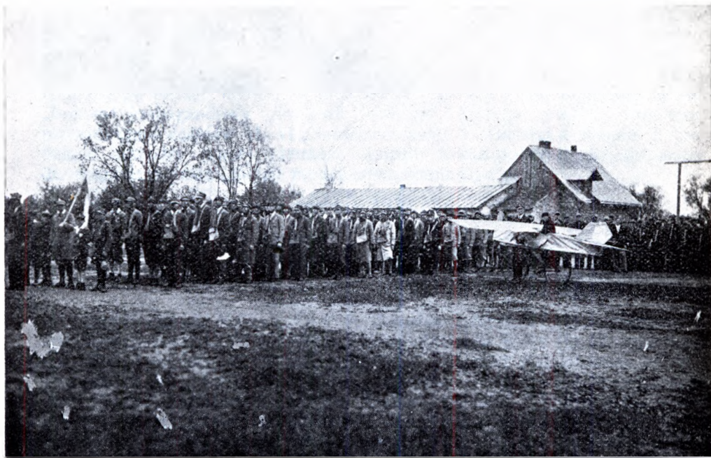
Pochód młodzieży gimnazjalnej w maskach przeciwgazowych.