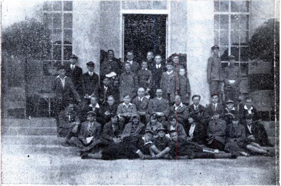
Wycieczka młodzieży gimnazjalnej w towarzystwie P. Dyrektora zakładu i PP. Prof. na Powszechnej Wystawie Krajowej w Poznaniu (lipiec 1929 r.).