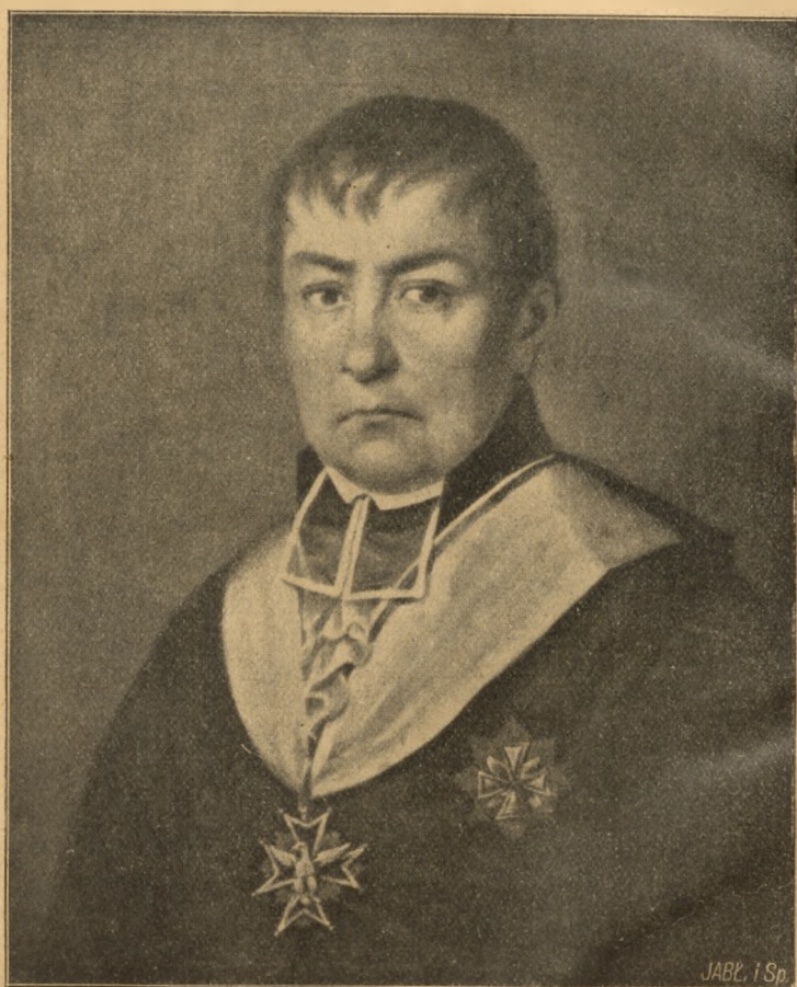
Ks. HUGO KOŁŁĄTAJ WEDŁUG PORTRETU J. PFEIFRA Z ROKU 1810.