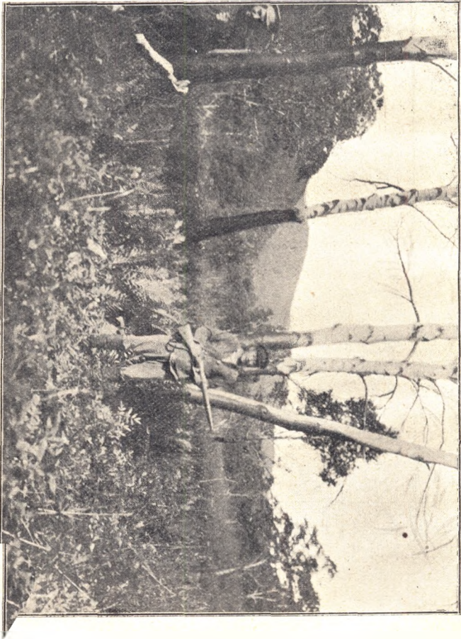
Ryc. II. Taz w puszczy leśnej.