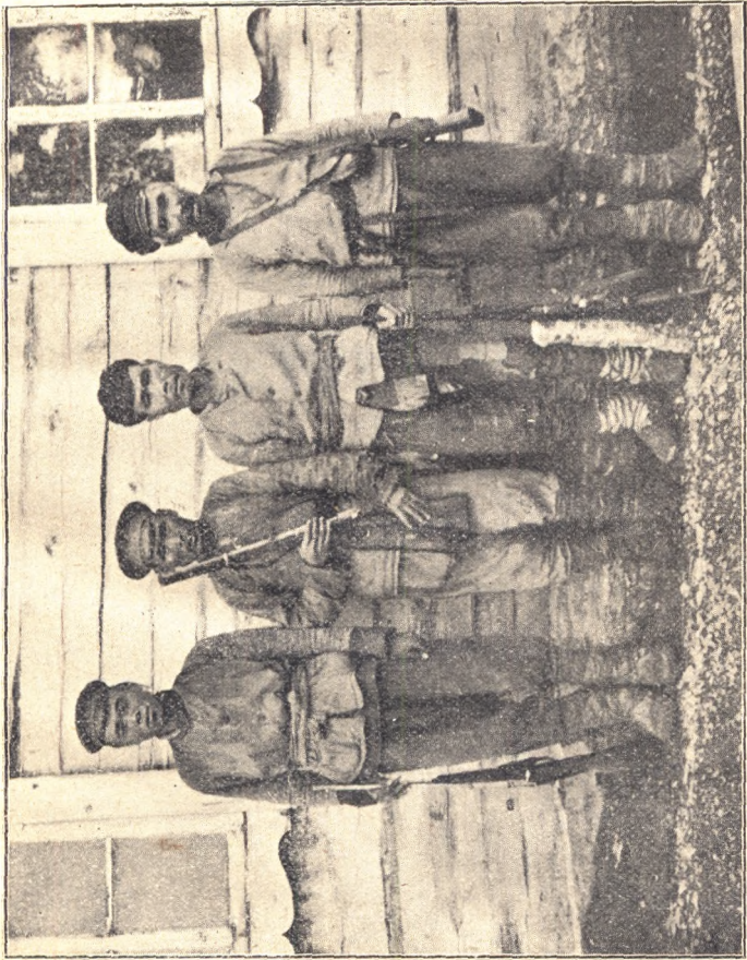
Ryc. III. Grupa ostatnich Tazów.